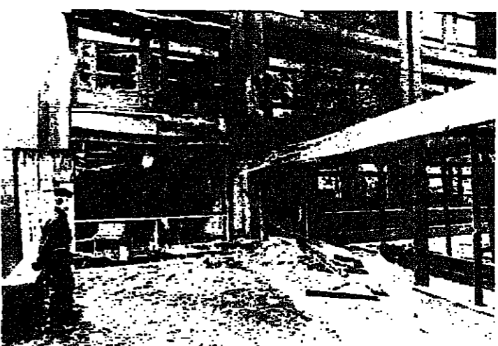
الدمار الذي خلفه الانفجار الثاني في مركز الكونغرس التابع للجمعية البرلمانية للحلف الأطلسي

ذكر الراديو البلجيكي أن قنبلة ثلثية انفجرت في بروكسل أمس، وأعلنت المجموعة التي قالت أنها فجرت قنبلة أمس الأول في مقر الجمعية البرلمانية للحلف الأطلسي مسؤوليتها عن انفجار أمس. وقال الراديو أن الانفجار الذي وقع في بروكسل في ١٦ من الشهر الجاري، وقع في مقر الجمعية البرلمانية للحلف الأطلسي، وهو مقر الجمعية البرلمانية للحلف الأطلسي، وهو مقر الجمعية البرلمانية للحلف الأطلسي، وهو مقر الجمعية البرلمانية للحلف الأطلسي.